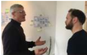
- netværk og viden